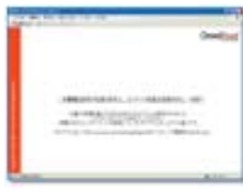
●プリントスクリーン/キャプチャソフトも制御。