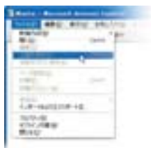
●IEの出力機能を制御します。